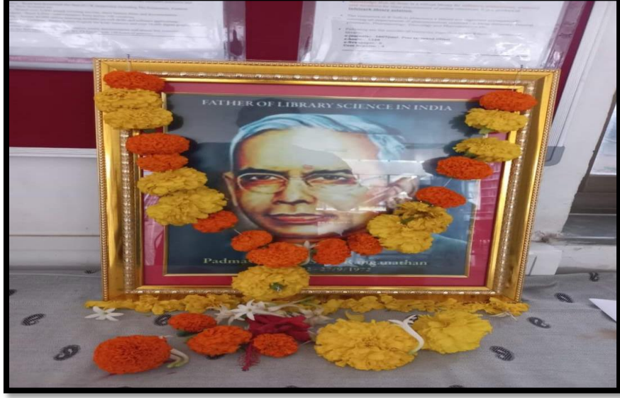
भारतीय ग्रंथालयशास्त्राचे जनक डॉ. एस आर रंगनाथन